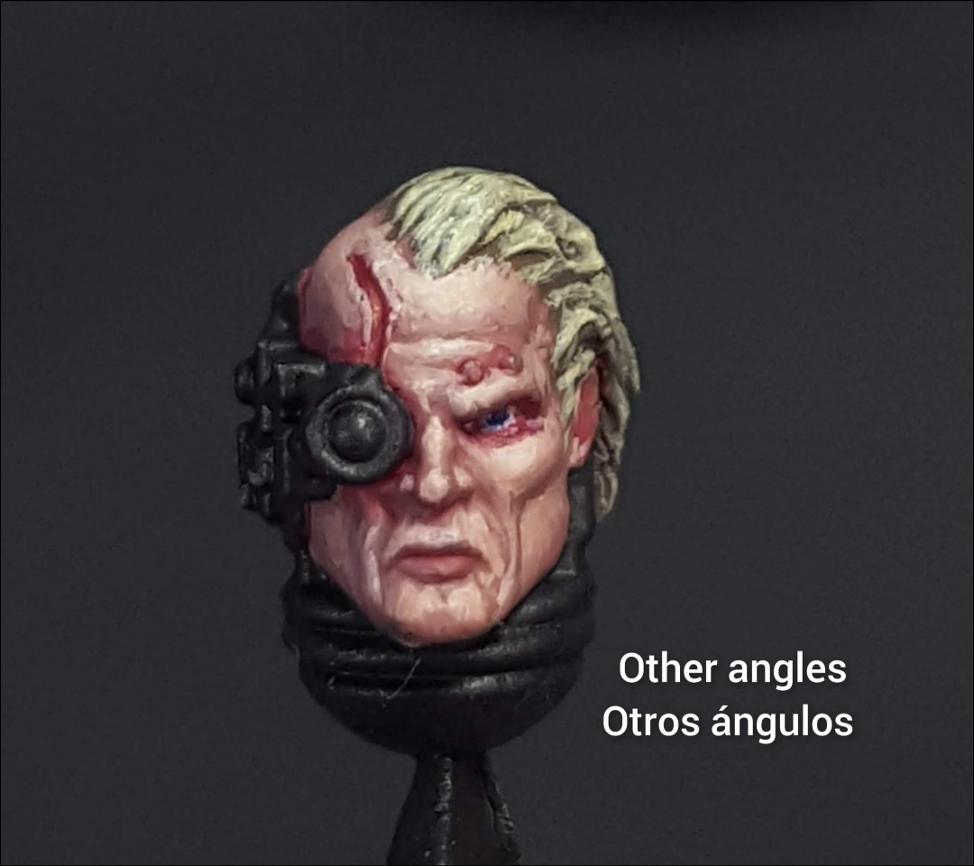
Other angles Otros ángulos