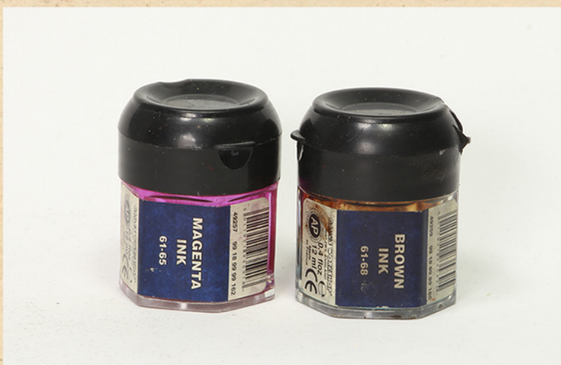
MAGENTA INK, CITADEL BROWN INKS, CITADEL