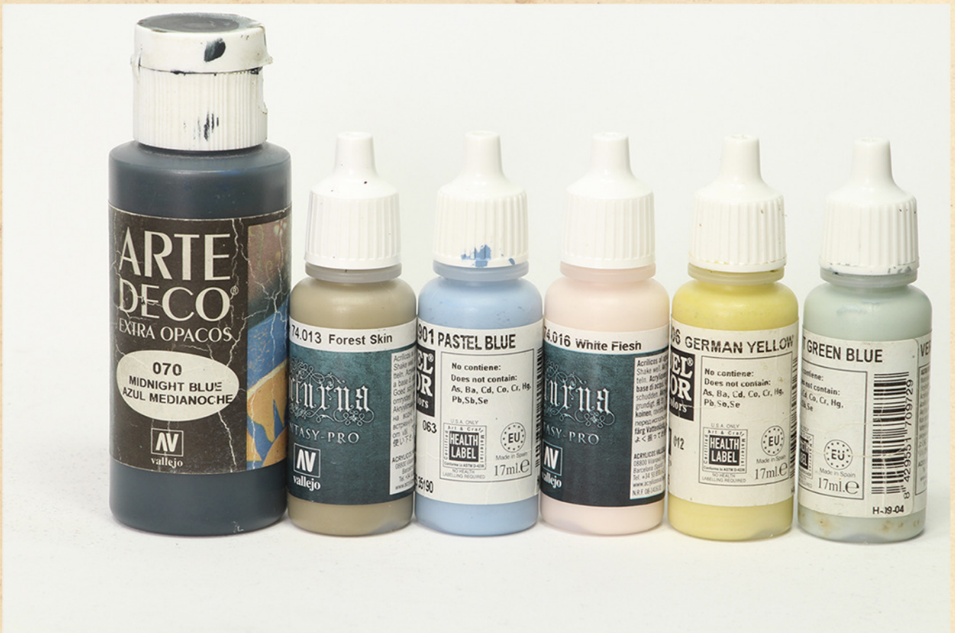
MIDNIGHT BLUE, ARTE DECO, VALLEJO. PASTEL BLUE, VALLEJO. GERMAN YELLOW, VALLEJO